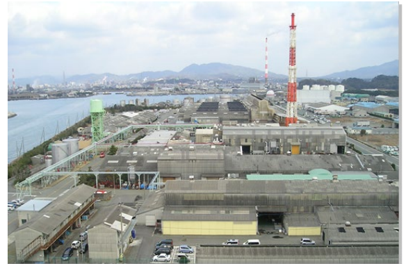
▲本社工場の全景写真