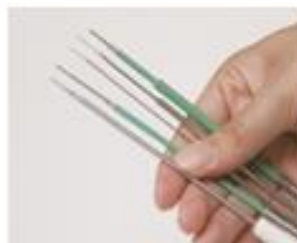
検体・試薬ノズル