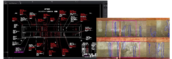
弊社開発品「マルツと図面化®」

国や自治体が管理する橋やトンネル道路附属物などの点検業務を効率化・省力化するために AI・ロボット開発を行っています。さらに自社開発システムを活用して、図面作成の一部工程を障害者施設にアウトソーシングする事業を展開しています。また、開発のみではなく実際に構造物の点検業務を請け、開発に必要となるデータを現場より収集します。