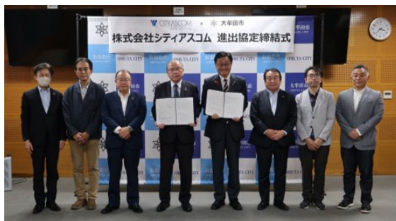
大牟田ラボ進出締結式

★2022年 10月 地域連携拠点として大牟田市に『シティアスコム大牟田ラボ』開設