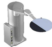
大気用搬送ロボット 【RR756L15】