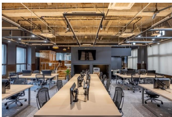
ICT KŌBŌ ARIAKE