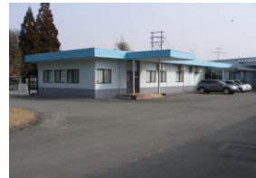
研究室棟(品質保証室)