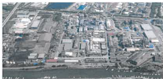
デンカ大牟田工場

電池材料として欠かせない導電性カーボンブラック、半導体封止材用のフィラーとして使用される非晶質シリカ、液晶テレビやスマートフォンのバックライトに使用される蛍光体。いずれも世界で高いシェアを誇るグローバルな製品を製造しています。また、電鉄、産業機器など大型モーターの制御部品には、回路基板や放熱板として弊社の製品が広く使用されています。無機化学で培った技術を生かし、先端材料をさまざまな分野に提供しています。