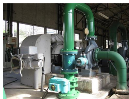
流量計・送水圧制御弁