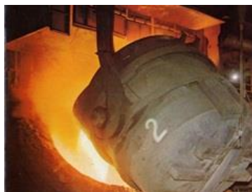
製鉄に欠かせない仕事です

鉄鋼産業の創成期より共に歩み続けて一世紀。一步前の精神で、新しい価値の創造に努めてきました。決して留まることなく、常に未来をみつめ、既成のものにとらわれずに改革・革新を行い、時代が求める新しい価値を生み出すには、強い信念と何ものも恐れない力強い“チャレンジ精神”が必要です。若い個性を尊重し、大切に育て、すばらしい果実として実らせ、今後も新しい日本の力になりたいと願っています。