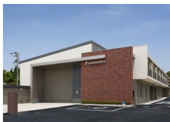
山崎高等技術専門学校