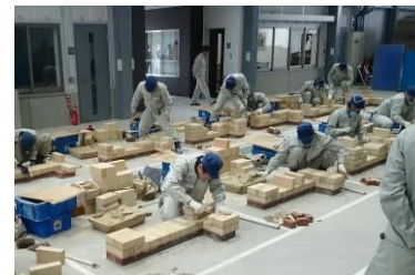
自社で技能士を育成します