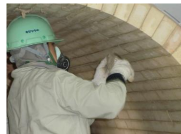
設備を守る耐火物を施工します