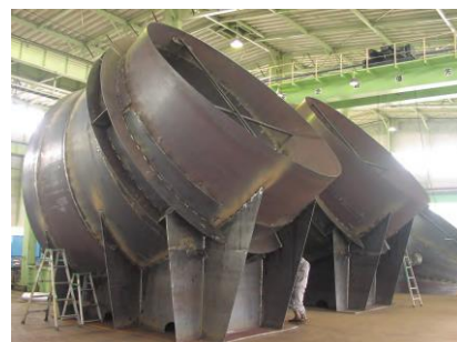
プラント工事も行います