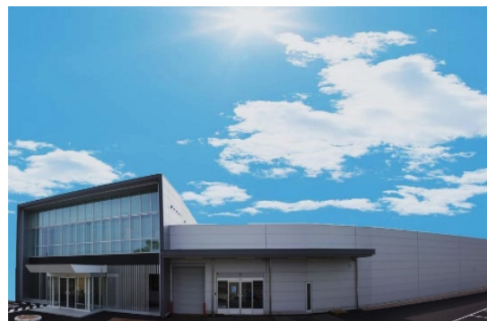
本社事務所兼工場

『PVDコーティング技術』『高性能研削技術』の二つの技術を1つの工場内で行えることに加え非接触の高精度測定装置による品質管理体制を整えた、完全一貫生産によるワンストップサービスを確立し、「 ナノワープ®サービス 」の名称でお客様に提供、高い評価をいただいています。