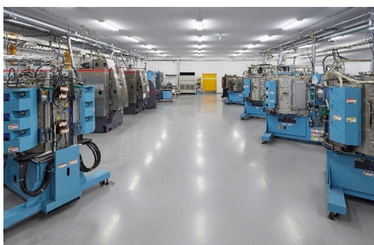
PVDコーティング装置 全12台