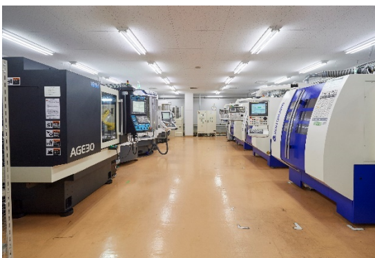
高性能 CNC 工具研削盤 全12台