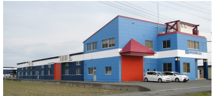
【 本社工場 】