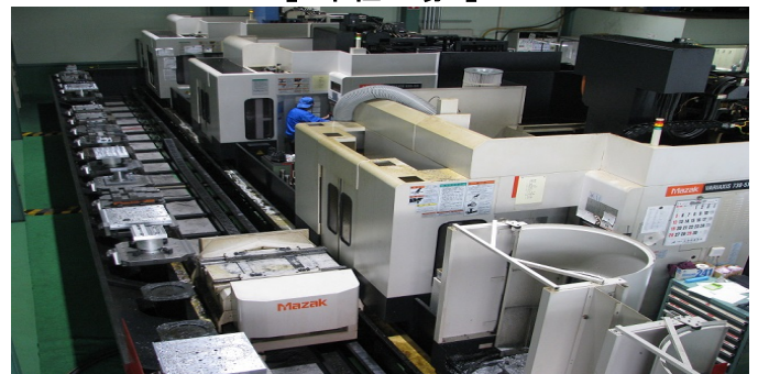
【 五軸加工機 】