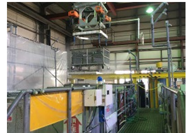
ノンクロム処理設備