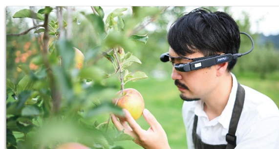
遠隔作業支援サービス『RemoPick®』