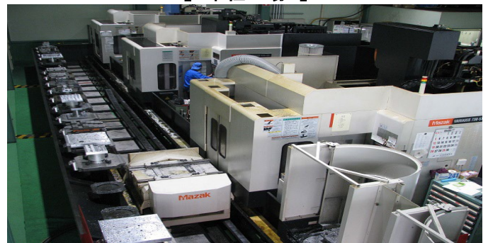
【 五軸加工機 】