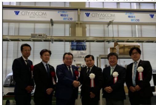
「シティアスコム起業家工房」の施設開設記念式典