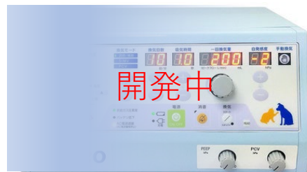
動物用医療機器（呼吸器）