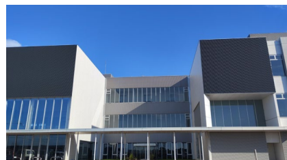
エコサंकセンター外観

日々色々な情報が飛び交い、世の中が 目まぐるしく変化する時代に、 大事なものは何かをきちんと見極め行動する 自分を自ら創り、働く仲間、協力企業と共に 社会貢献へ繋げていく。