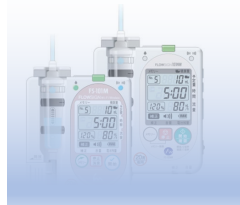
自然落下式輸液装置